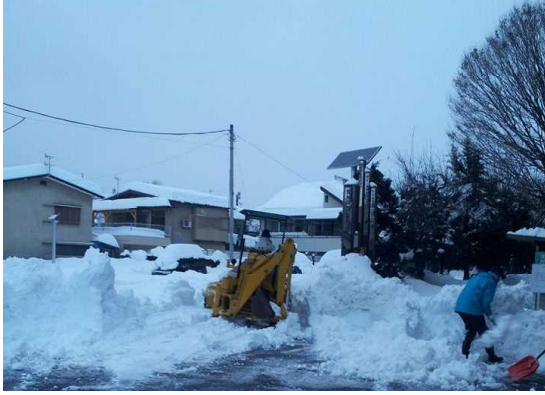
●2月15日(土)現場に足を運び除雪状況を自身で確認を行う