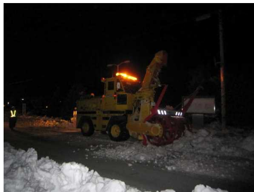
●2月22日(土)夕刻より、23日(日)早朝にかけて文化会館前の除雪作業の様子(写真は深夜0時頃) 「豪雪に対応頂きました皆様に感謝申し上げます」