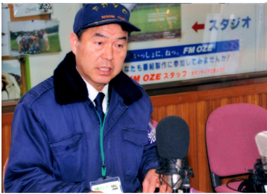
●2月17日(月)災害対策本部長として積雪被害や道路状況などの市内の現状をFMラジオ放送で報告